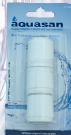
Art. 3990 3 Cartucce di ricambio

La durata media delle cartucce Dolce Doccia è di circa 2 mesi.