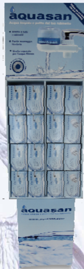
Art. ESP-1233 Espositore da terra completo

Contiene: 20 pezzi Art. 0012 Compact Box 12 pezzi Art. 3333 Pack 3 cartucce