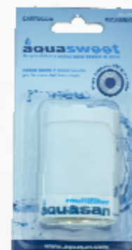
Art. 2299 Cartuccia di ricambio